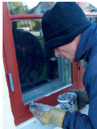
Selvom det er blevet koldt, skal de sidste vinduer males.