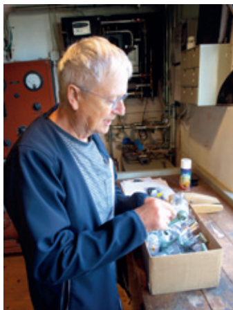
Der skal også ryddes op i værktøjet, så vi ved, hvor det kan findes igen.

Her er lidt billeder fra en helt almindelig onsdag på museet: